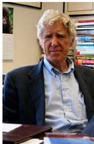
Lester R. Brown Earth Policy Institute

Lester Brown anul acesta a lansat ultima sa lucrare, “Planul B 4.0”, pentru salvarea economiei mondiale și a planetei. Aceasta a creat un fel de nou SOS, cum era considerat primul raport al Clubului de la Roma, și a pus în discuție necesitatea unei abordări serioase a acestei problematice, a dezvoltării durabile, și din punct de vedere ambiental, și din punct de vedere economic și social. El constata că toate aceste probleme semnalate de vreo trei decenii și ceva se agravează în momentul actual în fața unui fenomen pozitiv: creșterea spectaculoasă a Chinei și a Indiei, țări care aparțin lumii sărace și care au șanse să iasă din sărăcie, dar aceasta creștere agravează situația resurselor și a mediului. Și de aceea el ajunge la o concluzie dramatică: că nu există un model de societate și de economie care să fi avut toate meritele în propulsarea dezvoltării contemporane și după care merg și țările care vin din urmă, inclusiv China și India, este un model care nu poate fi extrapolat în lumea slab dezvoltată și nu poate deveni viabil pentru țările care l-au inventat și care îl practică.”